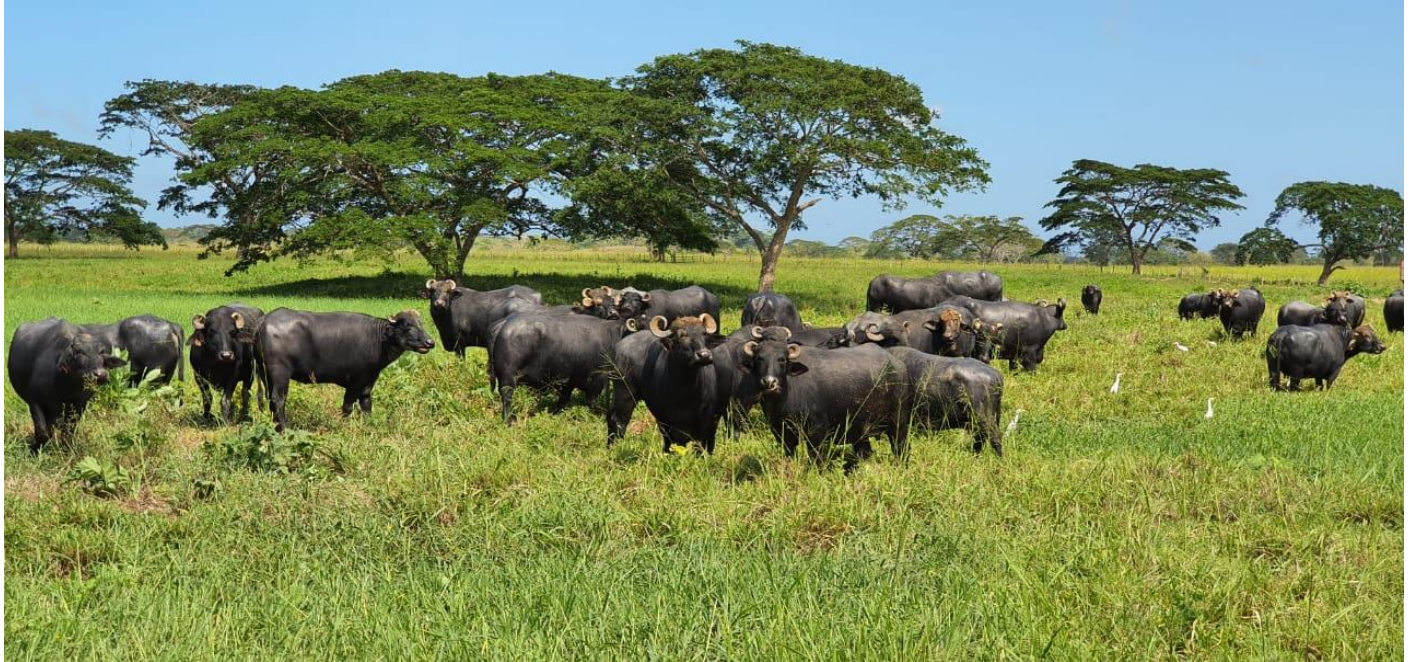
Foto: Nicola Fabbozzo, Agropecuaria Rosa Elena Rebaño: Búfalos ARE

Organización del proceso Reproductivo: Otro de los aspectos que se debe atender especialmente, cuando de escalabilidad se trate, es aquel relativo a la reproducción del rebaño. Acá puede notarse una diferenciación entre algunos criadores, que marca un estilo de gestión en cuanto al tema reproductivo, tal como se describe a continuación: